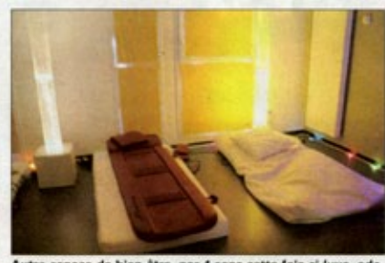
Autre espace de bien-être, par 4 sens cette fois-ci (vue, odorat, toucher et ouïe).

Etant donné que les résidents sont en hébergement permanent, l'objectif est qu'ils se souhaitent chez eux. Ici, dans la salle de bain "à l'italienne", un petit boudoir a été installé pour le bien-être du résident. Un petit coin coquet, pour prolonger la séance que la résidente aura passé dans la salle de soins esthétiques.