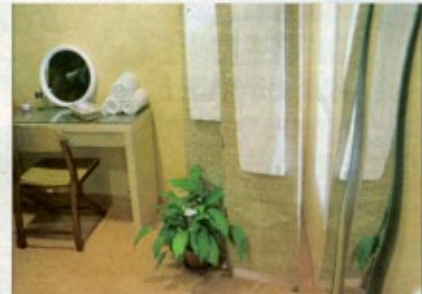
Les chambres des résidents sont personnalisables.

Deux personnes peuvent être accueillies en même temps. D'ici la fin du mois, le système d'hydrothérapie (par jets d'eau) aura été mis en place.