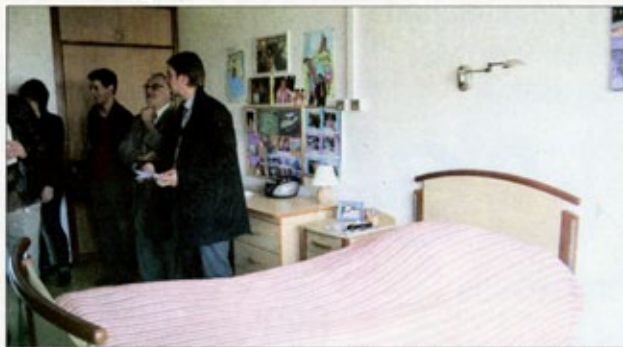
Là où parfois, certaines familles n'hésitent pas à abandonner leurs proches handicapés, à la MAS Trimaran, les adultes hébergés de façon permanente reçoivent régulièrement leur famille. Un studio (avec cuisine) a également été aménagé pour les personnes venant d'un peu plus loin.

Au cours de la visite, on découvre des chambres personnalisées : des photos trônent sur les murs ou les tables de chevet, des tableaux, des posters, les couleurs sont chaleureuses ou