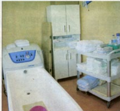
Les salles de bain sont équipées de baignoires adaptées aux personnes en fauteuil roulant, victime de handicap sévère.

Les éducatrices et personnels encadrant aident et soutiennent les personnes pendant leur toilette, à l'aide de moteur et de rails intégrés dans le plafond.